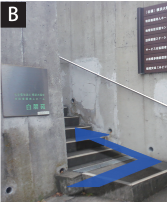
白朋苑の看板がある階段を上る